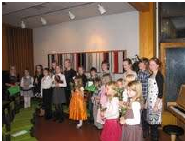
Syyssoittajaisiin osallistujat palkittiin ruusuin ja Marjaniemen Leijonien lahjoittamin lahjakortein.