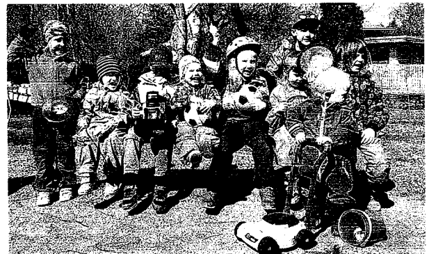
Marjaniemen Ipanat kiittävät Leijonia!

Marjaniemen Lions Club on tukenut Marjaniemen lapsia lahjoittamalla hiekka- ja pihaleluja Toivo J. Särkän puistoon ja Oskaripuistoon. Samalla molempiin puistoon tulee kesän aikana lukolliset hiekkavälinelaatikat, joiden koodit saavat kaikki halukkaat joko Marjaniemen Ipanoiden facebook-sivulta tai kyselemällä toisilta puistoilijoilta. Hauskoja puistoleikkejä!